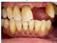
Gráfico 1: prevalência da doença periodontal